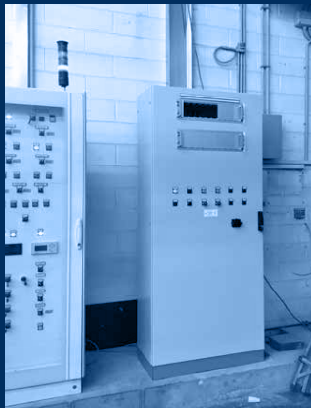
vista quadri rilevazione gas / gas detection panel view