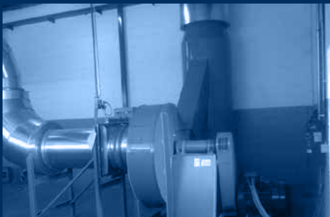
vista ventilatore Atex / Atex fan view