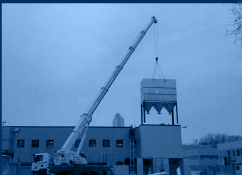
vista globale esterna impianto in fase di realizzo /external global view of the plant under construction