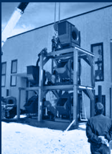
struttura e ventilatori in fase di montaggio / structure and fans assemblage's phase