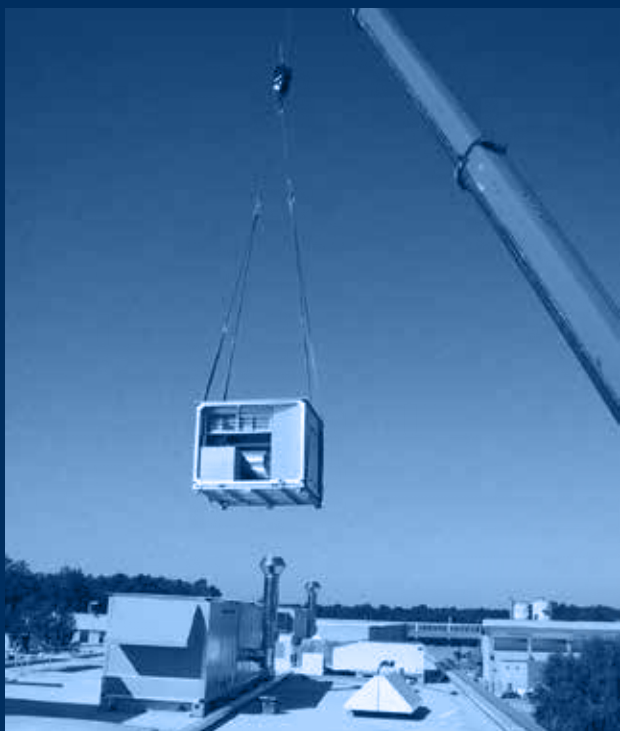
vista roof-top /roof-top view