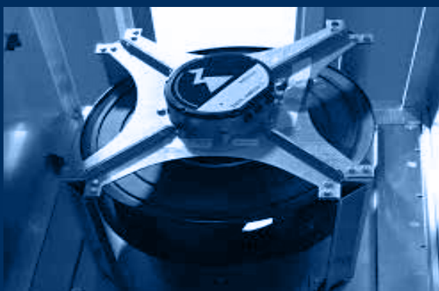
vista interna UTA - sezione ventilatori plug fan /internal view of air handling unit - plug fan