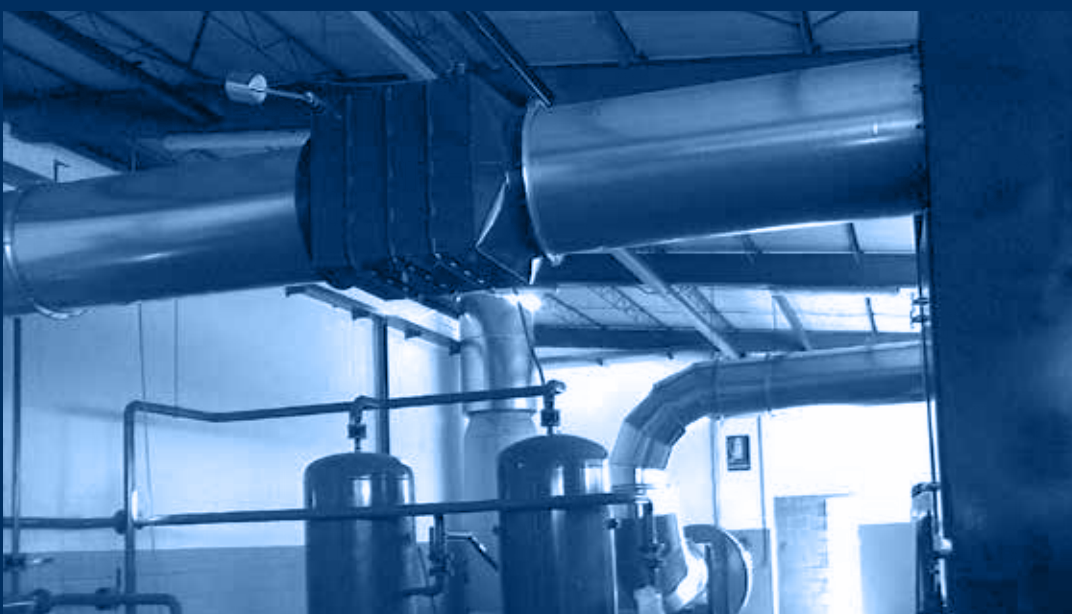
vista valvola a bilanciamento di non ritorno/non return balancing valve view