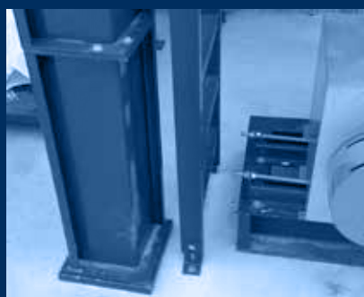
particolare struttura appoggio filtro e scala / filter support structure and stair