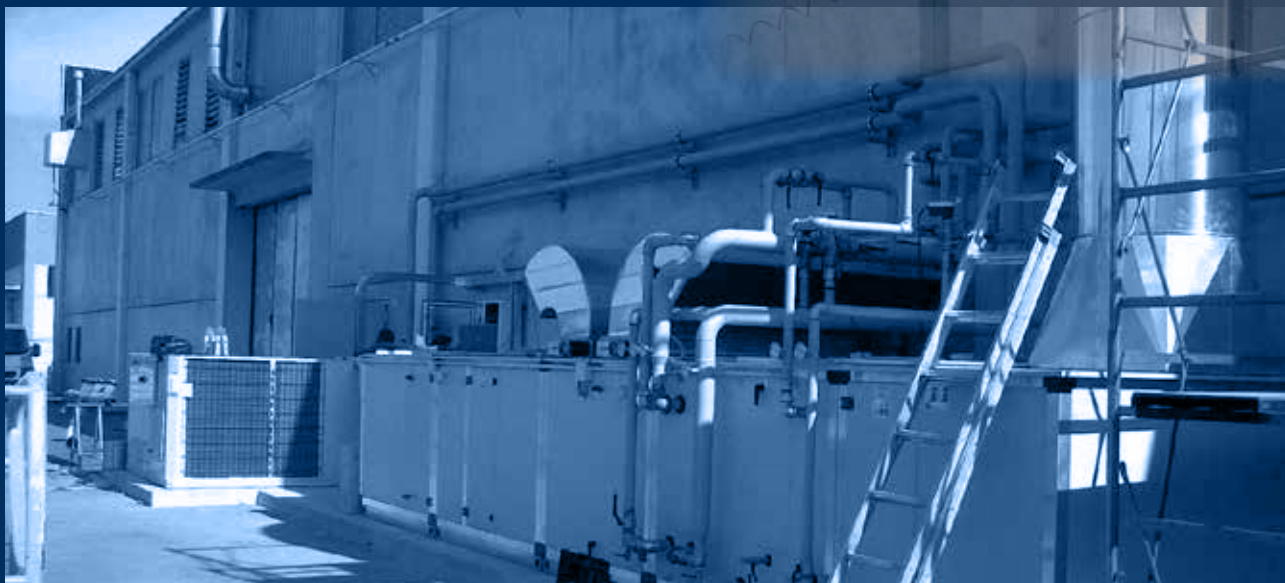
vista globale esterna impianto in fase di realizzo /external global view of the plant under construction