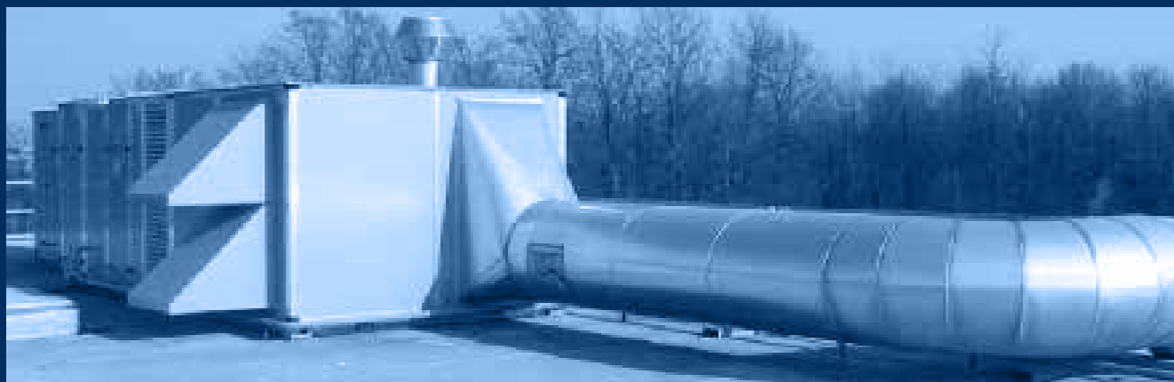
vista frontale unità n°3: canalizzazione mandata aria coibentata con finitura alluminio /front view unit n°3: air delivery canalization cohibented by aluminium finish