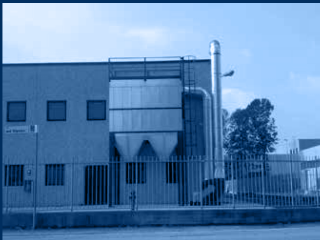
vista filtro depolveratore a maniche /sleeve filter view