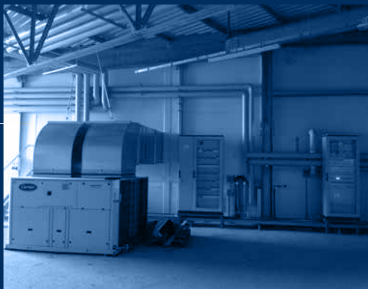
vista refrigeratore scroll canalizzabile condensato ad aria /air cooled scroll chiller view