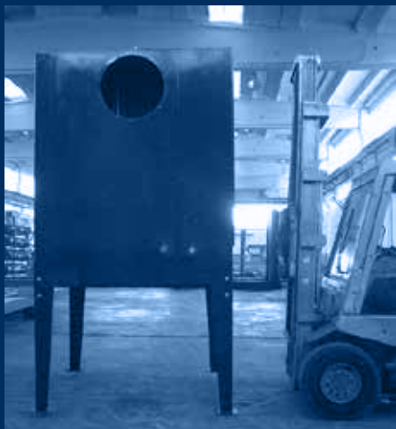
vista unità filtrante / filtering unit view