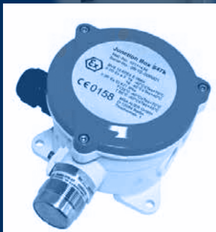
vista sensore catalitico Atex / Atex catalytic sensor view

environmental monitoring with certified calibration classification of the area: Atex zone 1