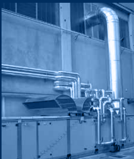
vista UTA sezione camera miscela e distribuzione H 2 O processo /UTA's mixing chamber and H 2 O distributions view