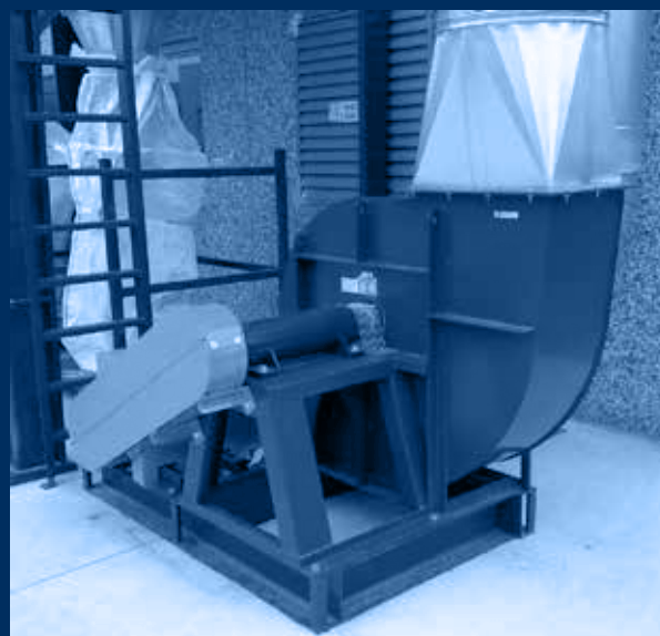
ventilatore aspirazione linea n°1 / suction fan line n°1