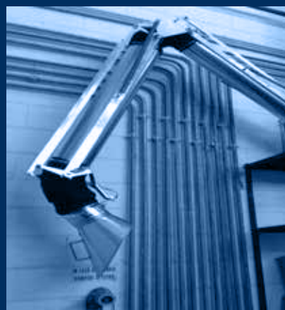
vista bracci aspiranti / suction arms view