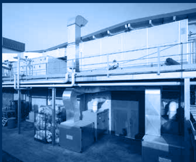
impianti posizionati su soppalco esterno / external plant view