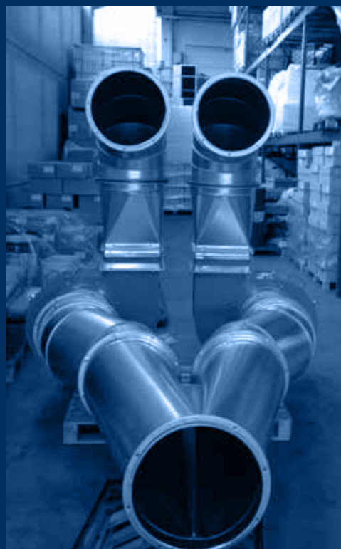
vista ventilatori Atex e plenum / Atex fans and plenum view