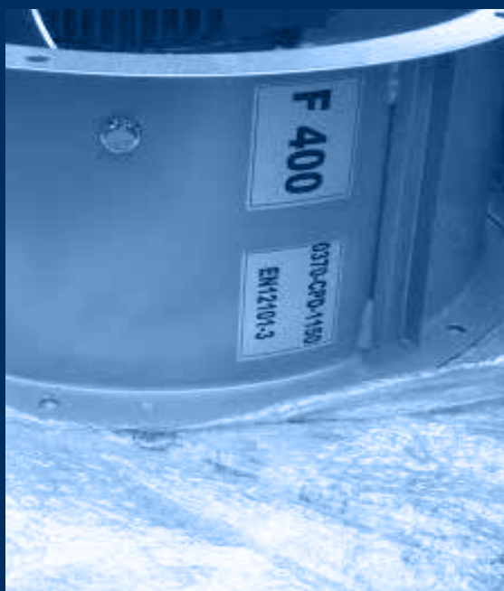
vista evacuatore forzato 400°C/2 h / extraction fan 400°C\2h view