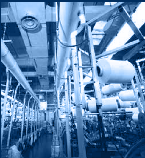
interno tessitura / inside of weaving department