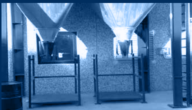
vista sistema di scarico polveri con attuatori flessibili a membrana /dust exhaust system with flexible shutter