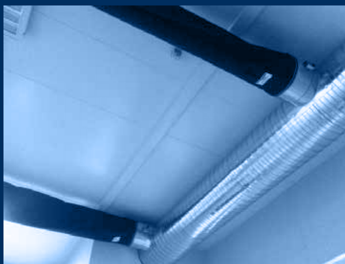
vista canalizzazione JET IN classe 0 /jet in ducts class 0 view