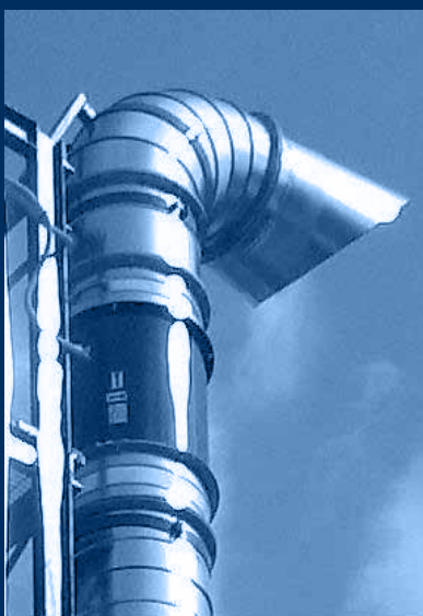
vista ventilatore ATEX e ancoraggio / ATEX fan view and anchorage