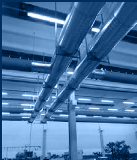
vista distribuzioni interne al reparto / internal view of air distributions with jet-in duct

impianto di adduzione gas metano al servizio roof-top realizzato secondo norma UNI 11528:2014