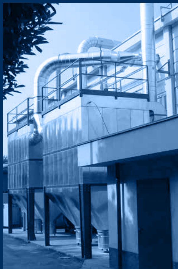
vista filtro a maniche / sleeve filter view