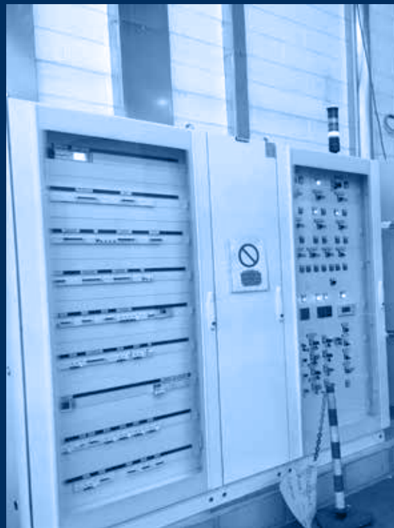
vista quadri centrale potenza e centrale elettronica /power panel and electronic panel view

monitoraggio ambientale con taratura certificata classificazione dell'area: ATEX Zona 1