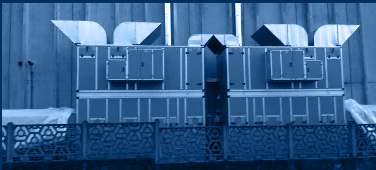
vista globale esterna impianto /external global view of the plant