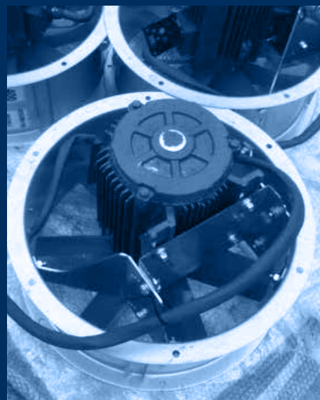
vista ventilatori di estrazione 400°/2h. /extraction fans resistant to 400°C\2h view