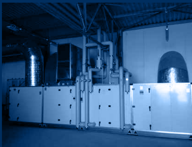
vista unità di trattamento aria /air handling unit view