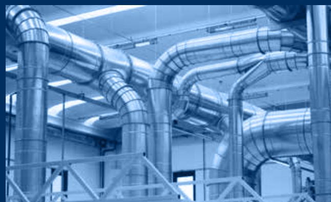
vista impianto interno / internal plant view