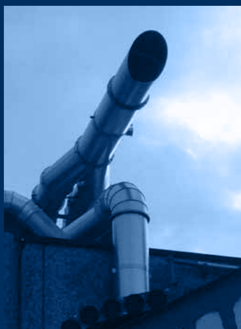
vista espulsione aria / exhaust air view