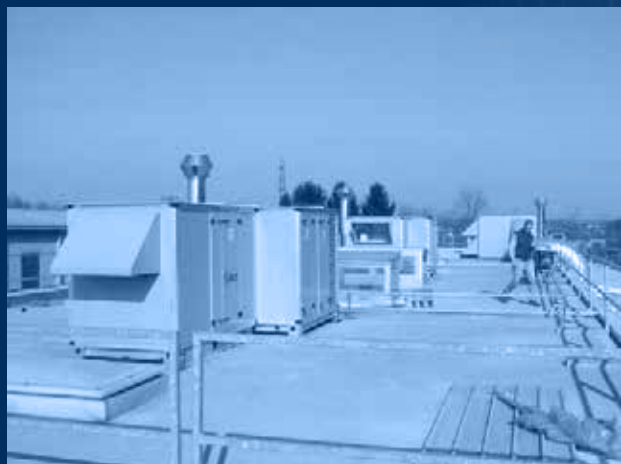
vista unità n°1\2\3/units n°1\ 2\ 3/ view