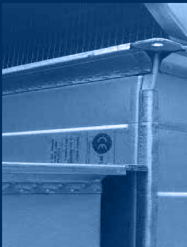
vista condotte certificate CE per impianto SEFFC /certified CE ducts view