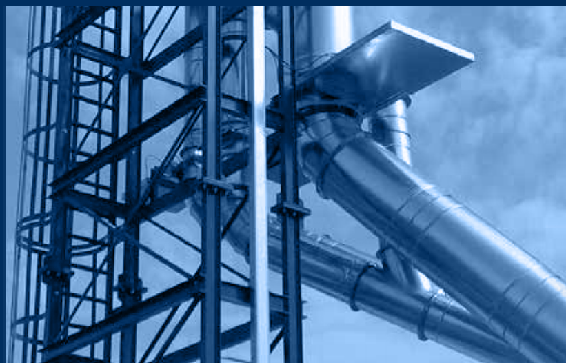
particolare struttura e serrande ATEX / structure and ATEX shutter view