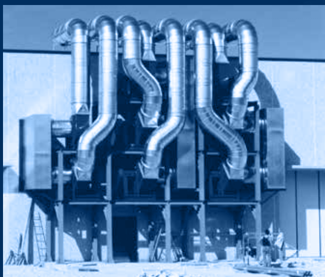
vista impianto esterno completato / external completed plant view