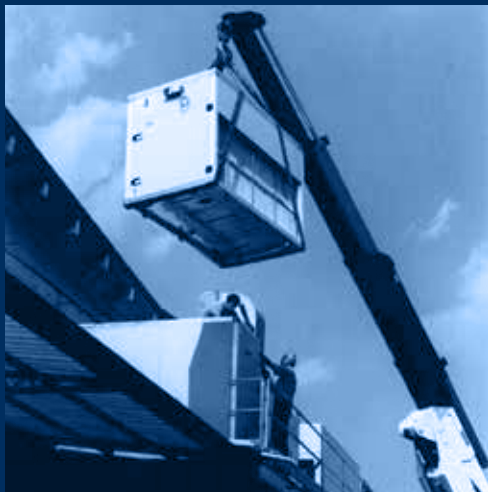
fase di montaggio recuperatore /phase of heat recover assembly