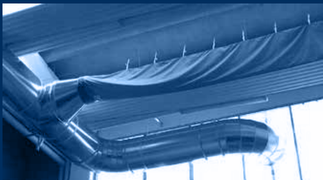
vista interna distribuzione immissione e canale jet-in / internal view of air distributions with jet-in duct